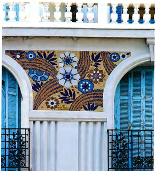
Détail de l'immeuble "La Couronne", Promenade des Anglais

www.candidaturepatrimoine mondial.nice.fr