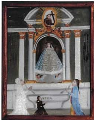
Vers 1800 : Prière d'une famille au pied de l'autel de N.-D. des Grâces