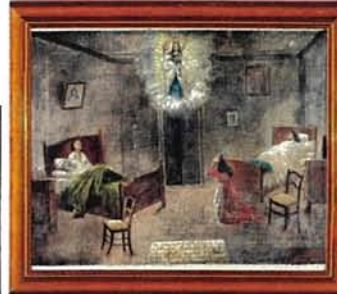
Avril 1900 : un père et sa fille, malades de la variole, guéris à Menton