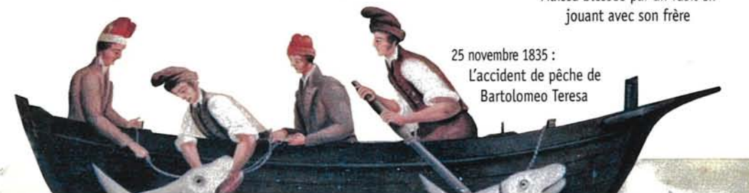
25 novembre 1835 : L'accident de pêche de Bartolomeo Teresa