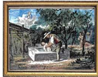
9 juin 1865 : Antoinette Depo sauvée de la noyade, Villa Clary à Nice