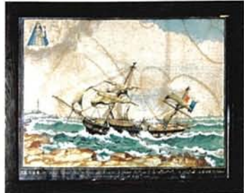
19 février 1855 : le transport de troupes «la Nomade» en perdition sur les côtes de Crimée