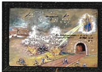
26 mai 1944 : Nice bombardée par l'aviation américaine