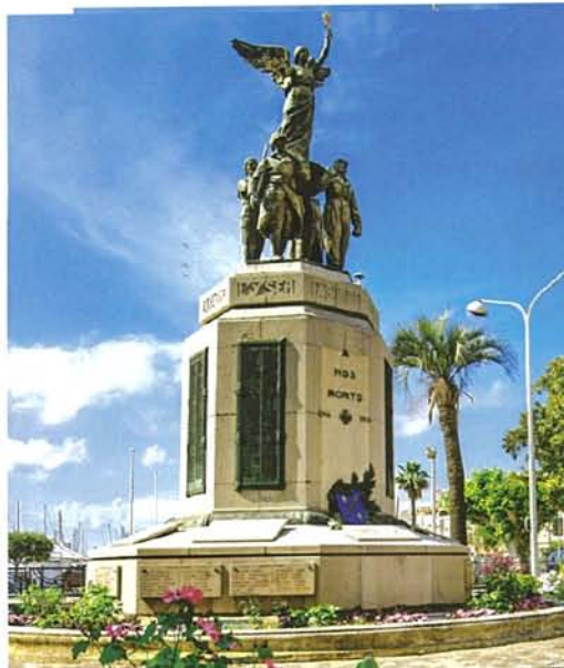
Au sommet, un véritable pavois gaulois qui porte la victoire en triomphe.