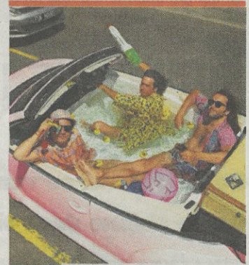
Le trio pop Naive New Beaters est au 109 à Nice ce samedi soir.