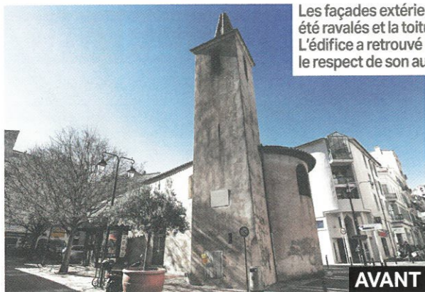
Les façades extérieures et le clocher ont été ravalés et la toiture de la chapelle refaite. L'édifice a retrouvé une nouvelle jeunesse dans le respect de son authenticité.