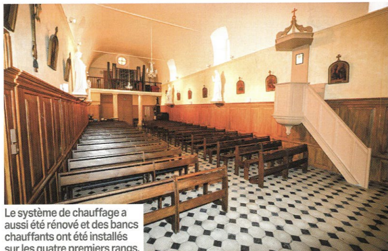
Le système de chauffage a aussi été rénové et des bancs chauffants ont été installés sur les quatre premiers rangs.