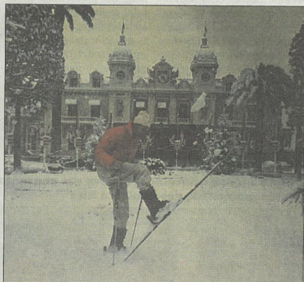
Exercice acrobatique, skis aux pieds, sur la place du casino à Monaco.