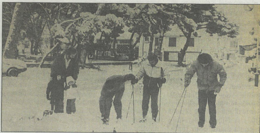
Une petite balade en ski, en chasse-neige, à Juan-les-Pins, devant le « Whisky à gogo ».

rué dans les magasins de sport pour acheter anoraks, gants ou encore après-ski. Comme dans de nombreuses villes du département, les écoles étaient fermées et la vie locale fortement perturbée. On enregistrait 25 cm de neige sur les routes. Peu, voire pas