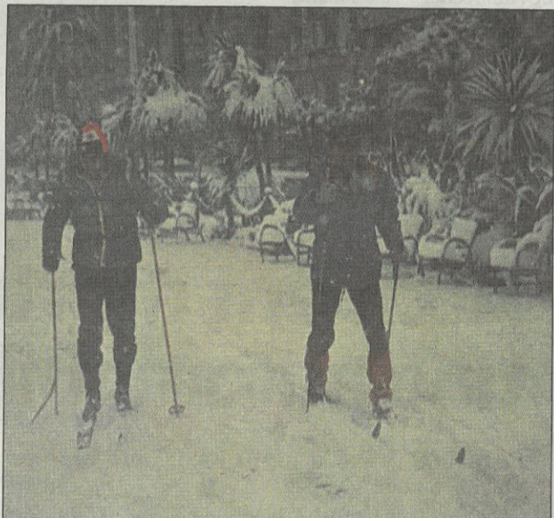
La promenade des Anglais à Nice (à ski) avec ses fameuses chaises... blanches !