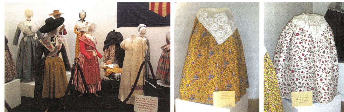
Des costumes provençaux seront exposés à l'espace Miramar du 5 au 11 février.