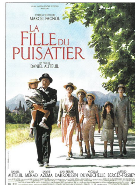
Figure indissociable de l'œuvre de Pagnol au cinéma, Daniel Auteuil donnera le 3 février au Palais une master class suivie de la projection de La Fille du puisatier qu'il a réalisé en 2011.

« Telle est la vie des hommes. Quelques joies très vite effacées par d'inoubliables chagrins. » Il faudrait vraiment beaucoup de ces chagrins pour effacer toutes