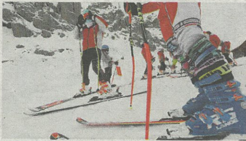
Des skieurs à la station d'Auron, en 2020.

DES ACTIVITÉS DE NEIGE à (re) découvrir à Isola 2000 et Auron. Dans le cadre du « World Snow Day » (la journée mondiale de la neige) demain, les stations organisent tout le week-end des initiations et des découvertes d'activités.