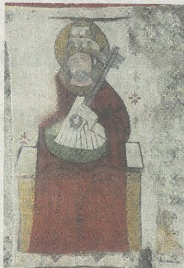
L'apôtre Saint-Pierre après sa restauration.

Cette restauration s'est appuyée sur les principes déontologiques de l'ECCO (Confédération euro-