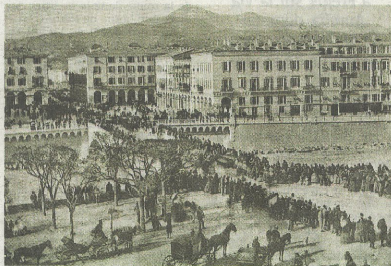
Place Massena en 1860, une des plus grandes réalisations du Consiglio d'Ornato : la place était au cœur des plans régulateurs fixés par les membres de ce conseil qui ont jeté les bases de la « Nice moderne ».

Dès lors, le Consiglio d'Ornato devient l'organe directeur de la mise en application du plan Scoffier. Le chantier à venir est considérable. Il faut d'abord redresser, aérer, élargir les rues de la vieille cité, activer la construction d'égouts, travailler au nivellement régulier du sol, endiguer le Paillon pour pouvoir enfin le franchir et jeter dans la vaste plaine du Camp Long (la rive droite du Paillon) les bases d'une ville nouvelle en s'appuyant sur le faubourg Saint-Jean Baptiste.