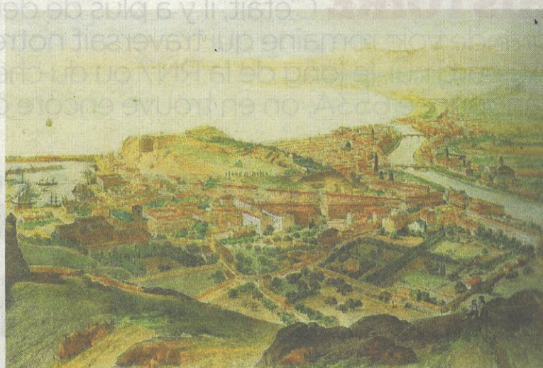
Vue de Nice depuis le Mont Vinaigrier vers 1848 avec les espaces à combler. DESSIN DE ALFRED GUESDON, LITHOGRAPHE ET ARCHITECTE - ARCHIVES DES ALPES MARITIMES.

Le souverain se réserve aussi le droit de régler les litiges et les difficultés inhérentes à de tels travaux. Pour cela, il institue