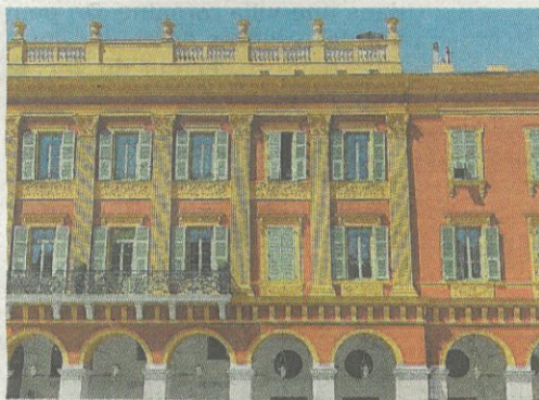
Les immeubles de la Place Massena ont conservé la base des plans d'origine. DR

IL Y AVAIT certaines limites au pouvoir du Consiglio d'Ornato. Par exemple, il ne pouvait intervenir à l'intérieur des bâtiments, seulement sur la façade des édifices ; il n'était pas une juridiction et ne pouvait trancher les conflits que ses décisions pouvaient entraîner et en référer à la Regia Delegazione. Enfin, il ne pouvait disposer de fonds publics.